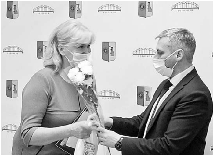
В конкурсе на звание «Лучшее общественное самоуправление» первое место занял ТОС «Черемушки» Перёдского поселения

Второе место — у ТОСа «Усадьба Ровное». Здесь реализован проект по благоустройству территории в д. Ровное Ёгольского поселения. Общая стоимость проекта — 69 тысяч рублей, из них областная субсидия — 59 тысяч рублей, софинансирование из бюджета сельской администрации — 10 тысяч рублей.